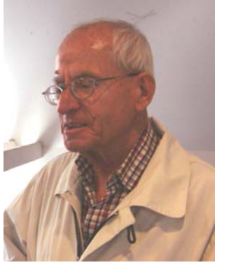
جهمال نه بهز نه لمانیا

ههشتا ساندا، بهچند گوژمیک هینانیه کهرکوک و مووسل و دیاله کووتو، نهوړو نهوانه، بوونه ته "عهره به رسهن" و، نهو عهره به دهوله مندانه کی نهوړو، پارتی و یه کی تی. نابه ریساریانه، دهیا نهیننه ههولپرو سلیمانی و دهوک و، دهینه خاوهنی خانوو و زهوی و زارو دوکان و قوتابخانه ی عهره بهی دهکریتوه پویان، دواروژ، نهوانهش دهینه "عهره بهی رسهن". نهی کاتی خوشی مهلیک فهیسه لی، دهستنیژی بهریتانیا، عهره بهی نهینانیه ههویچه دهشتی شارمزور، که نهانیه دواپی، به "جیب الگوریس" به نیو بانگبون! به لام هوار بو کی بهرین وبلوین بو کی