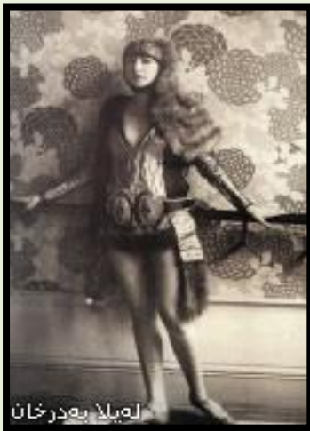
له پلا به درخان

له پلا به درخان له میژووی کوردستان و نه تهووی کورددا یه کهمین کچی کورده که له بواری هونهردا دههکه وتوووه. ههروهها یه کهمین کچیشه که له سهه ناستی رۆژهه لاتنی ناوین له هونهری بانی دا دههکه وتیبت و یه کهمیشه له ناسراوترین ژنه سهماکه دهگانی جیهان له سالانی ۱۹۳۰ دا.