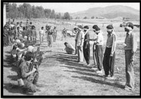
به شی یه که م نوسینی: هۆمه ر