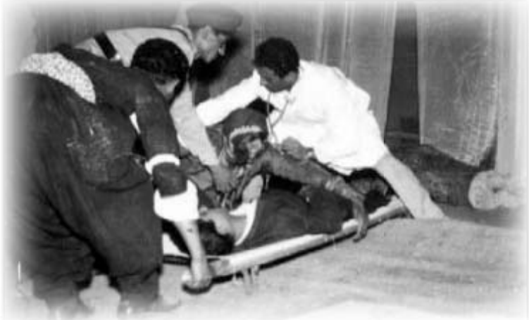
دیپه‌نیکی شائۆبی سالی 1954