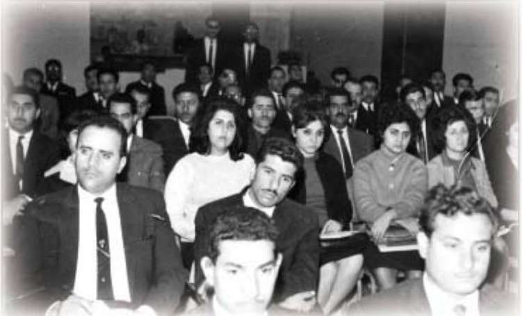
کۆلیجی ماف له‌ به‌غداد 1966

ماوه‌یه‌ک ئی‌موانیت له‌ دیوانی چاودێری دارایی نیشتماندووه‌، چۆن ده‌ستپێکرد و چۆنیش کۆتایی پێهێنا؟ دیوانی چاودێری له‌ راستیدا ئی‌موانیت راسته‌وخۆم تیدا نه‌کردوه‌، فه‌رمانبه‌ری دیوانی چاودێری دارایی نه‌بووم، به‌س وه‌کو پارێزه‌ریک هه‌ندیک جار ده‌بووم به‌ وه‌کیلی عامی دیوانی چاودێری دارایی له‌ هه‌ندیک دوا که‌ هه‌یانبوو، دوا‌یش چاودێریا په‌یوه‌ندیم هه‌بوو... ته‌علیقات چیه‌ له‌سه‌ر ئه‌و دیوانه‌؟ دیوانیکی ژۆر چاک بوو، تانیستاش هه‌ر ماوه‌ و به‌رده‌وامه‌، ئه‌وه‌ی که‌ بیرم دیت زیاتر له‌ 2700 راپۆرتیان نووسیه‌وه‌ له‌ ته‌مه‌نی پێشویاندا تا ئیستا، ئه‌و راپۆرتانه‌ی ژۆری گه‌نده‌لییه‌که‌ی حکومه‌تی تیدا و هه‌ندێ له‌وانه‌ی خۆشیان به‌ شاعیری گه‌وره‌ و نیشتمانه‌ره‌ور و نووسه‌ر و ئه‌دیپ ده‌زانن له‌رێگه‌ی