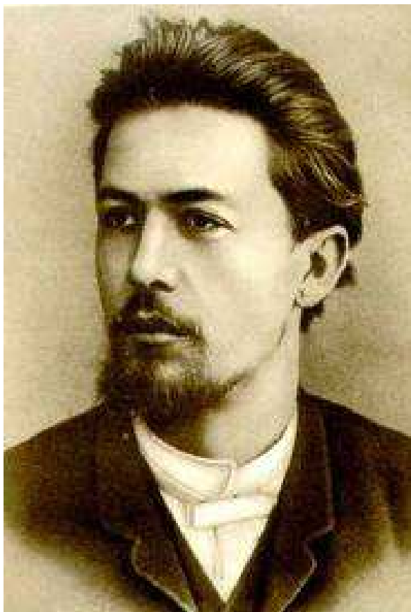
Alexander Aleksandrovich Bogdanov