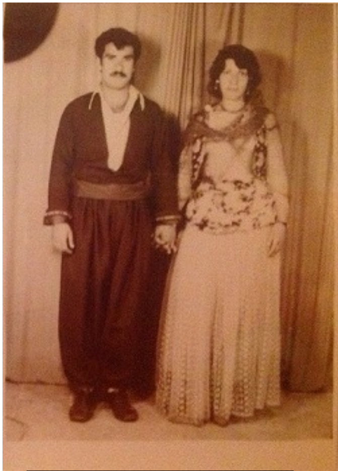
وینەى کاک رەوف و ھاوسەرى بەرپێزى کوبرا خانم

رەوف ماوہیەکی کەم لەزندانی ساواک راگیرا. دواى ئازادبوونی بەھۆی پێشینیەى سیاسیی خۆی و عەتای بۆ، لەھیچ دایرە و دەزگەیکەى حکومەتى بەبیانوی جۆراوجۆرەوہ وەریاننەدەگرت. ئەمە لەکاتیکدا دواى تەوابوونی دووسال سەربازی و ئازادبوونی لەزیندان، لەگەل کچی بنەمالەیکە لەخزمانی شاری بانە ھاوسەرگیری کرد، بە نیازی ئەوہی ژیانیکی ئاسایی لەگەل ھاوسەرکەیدا دەستپێکات. بەھۆی دەستکورتی و ھەژارییەوہ نەیدەتوانی دوکانیک دانئ کە لەرێگەى ھونەرکەیکەوہ بژێویی ژیانیان دابین بکات. لەبەر ئەوہ لەبارودۆخیکى ناخۆشى دەروونی و ئابووریدا ژیانیان بەپێوەدەچوو.