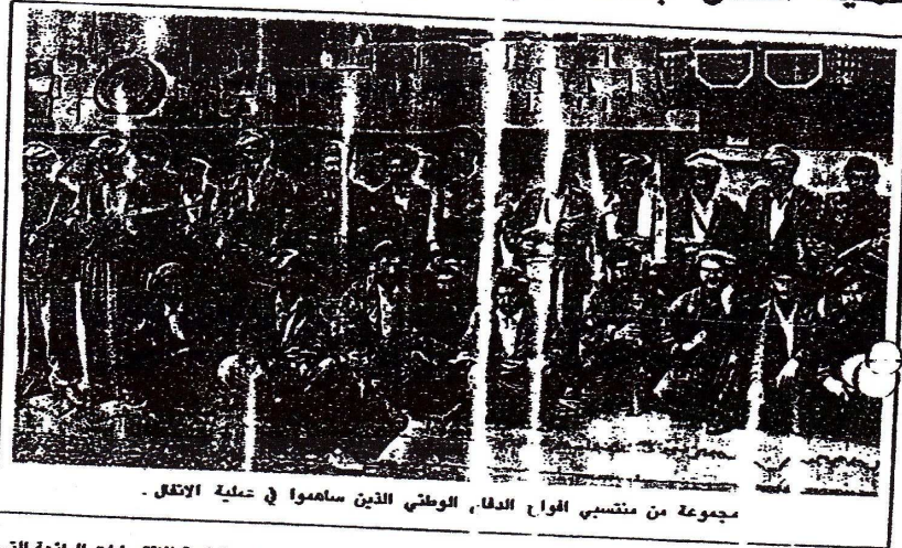
مجموعة من منتسبي الواج الدفاع الوطني الذين ساهموا في عملية الانفال .

ودعا الله تعالى ان ينصر جيش العراق وقائده المنظر . وقال الشيخ كمال محمد قادر امام وخطيب جامع الكويتي للذ وجيت عليها مللتنا عملاء ايران والقضاء عليهم لانهم اسس الثورة والشقاق بين ابناء وطننا الواحد وتدعو من الله ان يوفقنا على اعدائنا وان ينصر جيشنا بقيادة السيد الرئيس القائد صدام حسين .