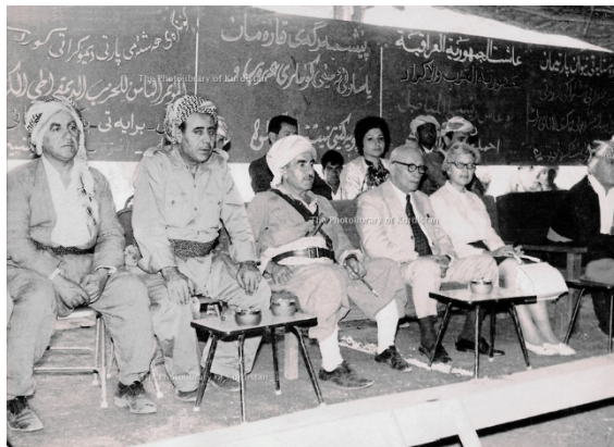
كامەران بەدرخان و ناتالىاى خىزانى و سېنەمخانى برازى و بارزانى لە كۆنگرەى ۸ى پارتى ديمۆكرات

ئەنستىتوتى كورد تۆمار بىكەن و مافى رەواى خاوەندارىەتى بەرھەمەكە ئەراى خاوەنە پراستەقینەكەى بگەرننەو و بوار نەدەن كە ئەو مافە بە هېچ شىو و شىوازىك لە مېر كامەران بەدرخان بەرى بگرتن . لەل ئەمە زى دەقى دەسكارى نەكراوى فەرھەنگەكەى مېر كامەران وەك خۆى پيارىزىرئ لۆ نەو و جىلى ئستا و داھاتوومان . كامەران بەدرخان كەسايەتییكى وەھا گاۋرە بوو كە مستەفا بارزانى لە ھەرەتى دەسەلاتى دا نامادە بوو وەك رىز لىنان ، ھەگبەى دەستى بۆ ھەنگرى ، ئىدى خوا ھەل ناگرئ ناو و دەنگى ئەو مرقوھ بەرز و ھەلكەوتووھى كورد بە ھج شىو بەك كوڤر بگرتتەو . بەدرخانپان سامانزىكى گاۋرە و گران و دەولەمەند و سنگىنيان لە وڤژە و پەيف و زمانى كوردى ئەرامان جى ھېشتتە كە ماپەى شاھنازى تىكراى مەردم كوردستانە . ئەركى نەتەوھى و مرقوڤى و مېزوۋىيى بئى ئەملا و ئەولای گشت لایەزىكە خپ ، بە تاك و كۆر و كۆمەل و دەزگا و سازى و رىكخراوھى ھەمە جۆر و بابەت كە ئەو سامانە بە نرخە ، كوردەكەو ماچۆ ، وەك گلپنەى چاۋ پيارىزن .