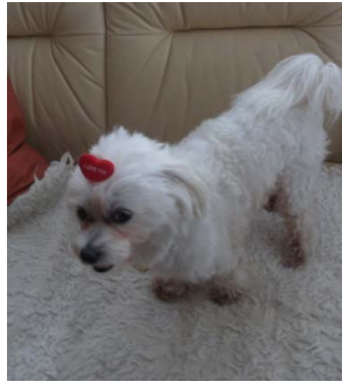
ماكسي وهويته الشخصية وحقه في السفر وحقه في الاقامة في العاصمة أم في المناطق الحدودية