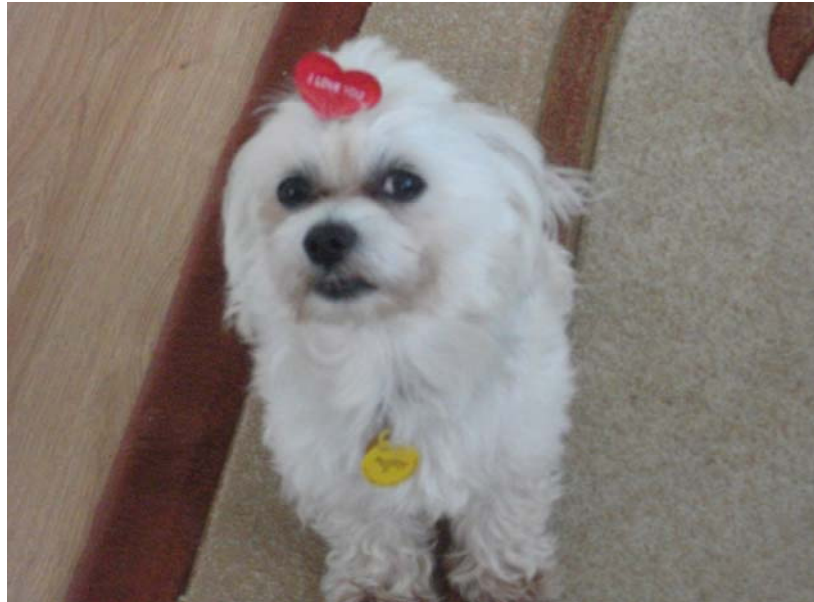
هوية ماكسي ووثيقة حصوله على اللقاحات المضادة

ماكسي وبكل افتخار يقف ويقول: أنظروا ففي عنقي حلقة معدنية مكتوب عليها أصلي وفصلي بينما في سورية نصف مليون كردي لم يصلوا بعد الى مرتبتي مع الاسف الشديد، حتى الكرد الذين يتمتعون بالجنسية السورية فمكتوب عليها بأن حامل الهوية هو عربي سوري!، وهذا شئ مرفوض لأنني أرفض ان أكون من تبعية جمهورية التشيك وذلك لأنني سلوفاكي من جمهورية سلوفاكيا المستقلة وهذا ما أرجوه للشعب الكردي في غرب كردستان بالاستقلال عن سوريا، ويعيش بكرامته كما أنا أعيش. هناك من يقول هذا تشبيه غير لائق، وباعتقادي إنه لائق وأكثر لأن الممارسات التي يمارسها النظام السوري بحق الشعب الكردي قد تجاوزت كل الحدود ووصلت الى حد لا يطاق نهائياً، وثانياً ان الكلاب في العالم ليسوا كـ (كلاب) سوريا أيضاً.